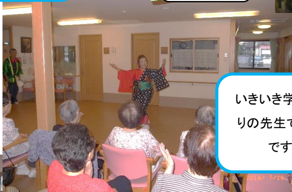
知恵っこよしゃれ