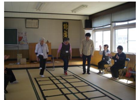
蛇田沖区会館でのふまねっと教室

ぱんぷきん株式会社では、女川町のあそびりテーション事業に続き、今年度より東松島市の委託を受け、年間 44 回の介護予防教室『ふまねっと教室』が始まりました。NPO 法人ぱんぷきんふれあい会でもサポートしています。