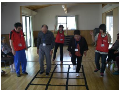
鹿妻地区でのふまねっと教室

昨年の 6 月に蛇田で体験会を初めて 1 年が経過しました。初めは 4 名、5 名だった参加者も 10 名を超えるようになり、「〇〇さん顔みせないけど、何かあったのかな？」「この間、足痛いって言ってたけど大丈夫？」などなど、人と人とのつながりを感じることができるようになりました。